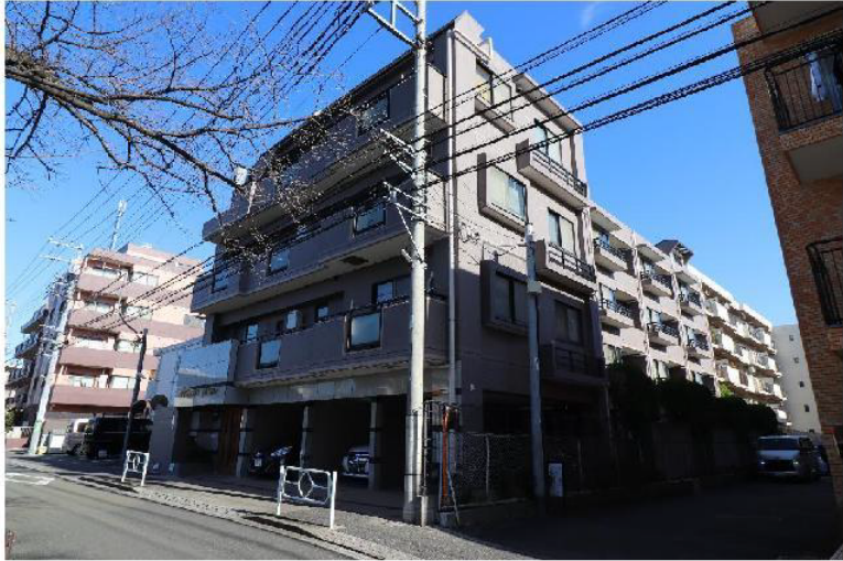
外観写真: 令和1年12月撮影