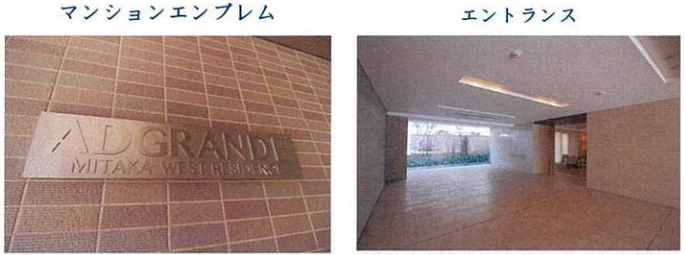
マンションエンブレム エントランス