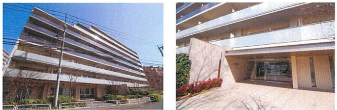
現地外観写真① エントランスアプローチ